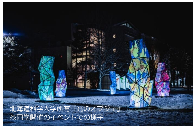
北海道科学大学所有「光のオブジェ」 ※同学開催のイベントでの様子