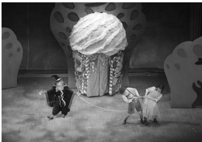
Kitara室内オペラ「ヘンゼルとグレーテル」 平成30年10月13日（土）、14日（日）