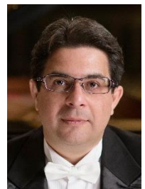
ガーボル・ ファルカシュ